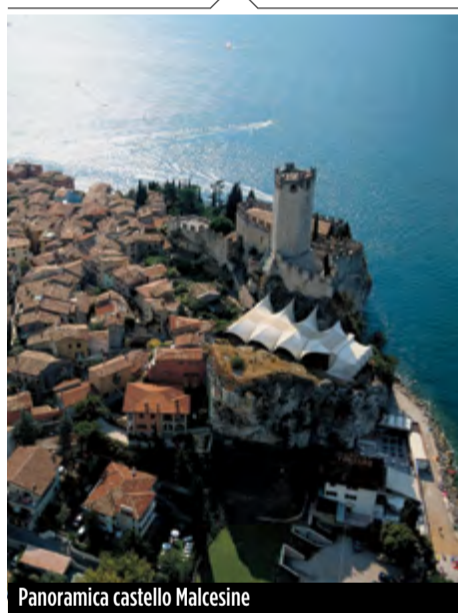
Panoramica castello Malcesine

Cene stellate sul lago di Garda: una manifestazione itinerante che toccherà alcune tra le più belle località della sponda veronese, partendo da Malcesine, proseguendo a Garda e Bardolino, per poi spostarsi nell'entroterra. L'obiettivo è quello di valorizzare i prodotti di un territorio contraddistinto da una cucina che privilegia la tradizione ittica, ma sa sfruttare anche una variegata offerta di eccellenze enogastronomiche. Sono oltre quaranta le varietà di pesce di lago censite e molti i prodotti a marchio Dop e Igp della provincia: l'olio extravergine d'oliva del Garda, l'asparago di Rivoli, il radicchio di Verona, il riso Vialone Nano, i formaggi del Monte Baldo. Creatività e sapienza di alcuni grandi chef stellati – Luigi Taglienti, Mauro Uliassi, Felice Lo Basso, Anthony Genovese tra gli altri – faranno il resto, proponendo ai commensali cene gourmet al costo di 60 euro a persona. L'evento, su prenotazione, si svolgerà presso gli hotel e i relais che parteciperanno all'iniziativa.